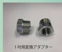
1吋変換アダプター