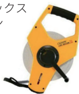
サンエックス ミリオン