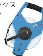
サンエックス スチロン